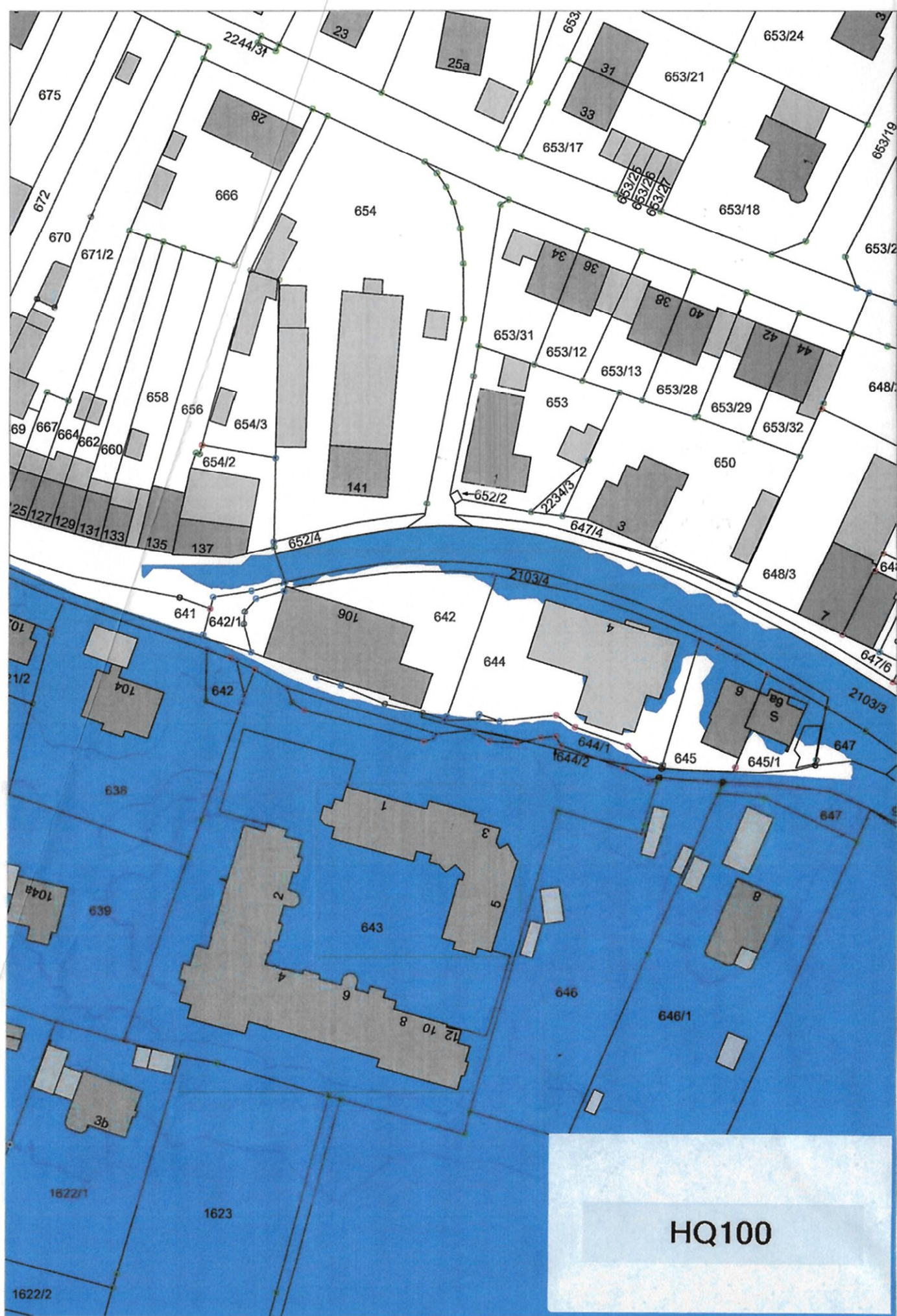
Lageplan 1 : 1000, bisherige Fassung