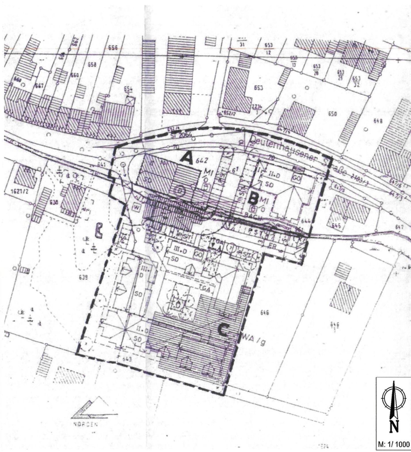
Lageplan 1 : 1000, geänderte Fassung